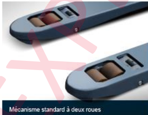
Mécanisme standard à deux roues