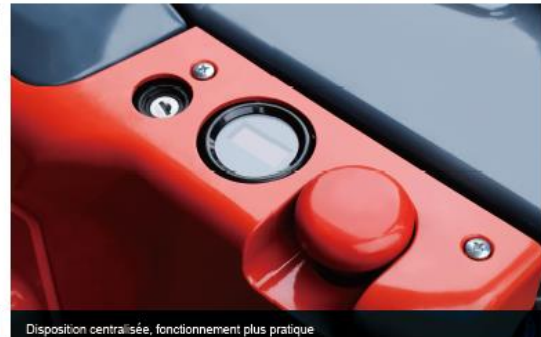
Disposition centralisée, fonctionnement plus pratique