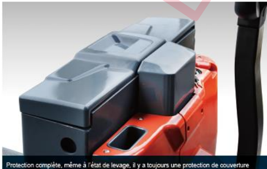
Protection complète, même à l'état de levage, il y a toujours une protection de couverture