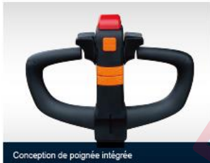
Conception de poignée intégrée